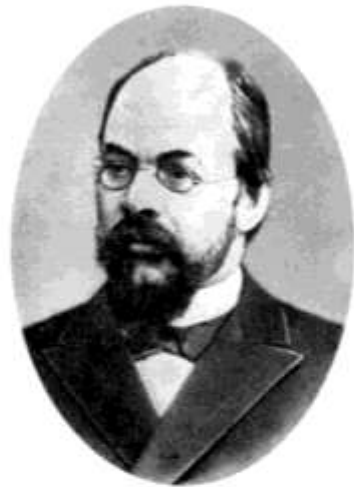
Отец Иван Владимирович Цветаев

Отец, Иван Владимирович Цветаев, - профессор Московского университета, известный филолог и искусствовед; стал в дальнейшем директором Румянцевского музея и основателем Музея изящных искусств.