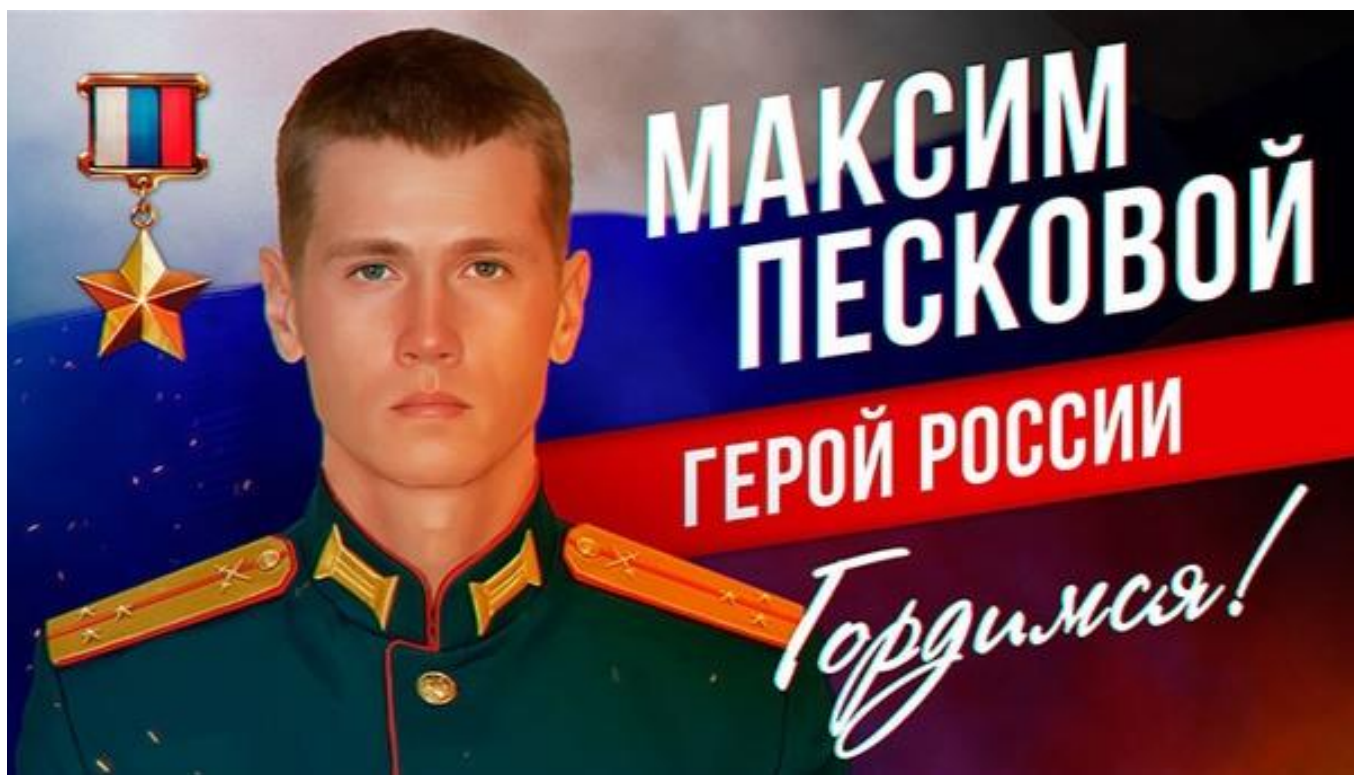
Герой - томич 05.04.2022, посмертно

Звание Героя Российской Федерации в настоящее время присваивается за мужество и героизм воинам, сражавшимся в «горячих точках», в спецоперации на Украине, а также за выдающиеся достижения при освоении космоса, новой авиационной техники, особые заслуги перед государством и народом.